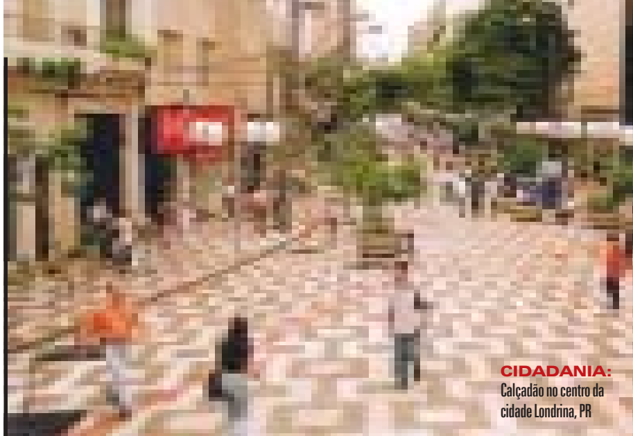
CIDADANIA: Calçadão no centro da cidade Londrina, PR